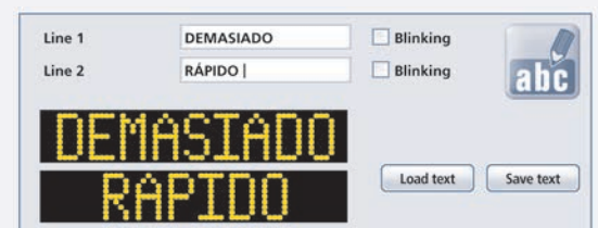
Crea tus propios textos y gráficos con el editor de LEDs.