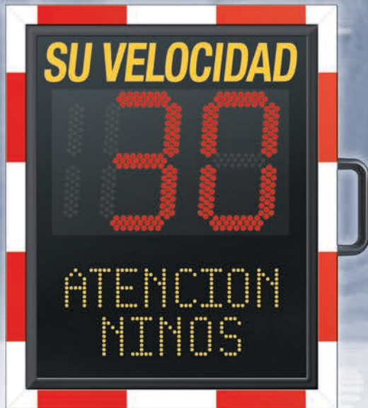
Dimensiones: 63,4 x 84,4 x 18,2 cm